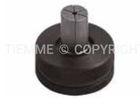
3447ESP Testina ad espandere per macchina a batteria e manuale Expander head for cordless and manual tool