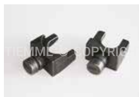
3447PRES Coppia di testine a pressare per macchina a batteria e manuale Couple of compression heads for cordless and manual axial pressing tool