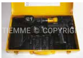
3448PRES Macchina per pressatura a batteria Cordless axial pressing tool