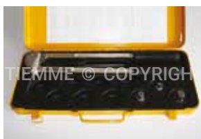
3449ESP Macchina per espansione manuale Expander manual tool