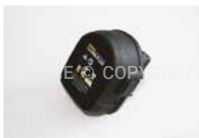
3448B Batteria Li-Ion 14,4Vdc/1,6 Ah per pressatrice e macchina per espansione Li-Ion 14,4Vdc/1,6 Ah for crimping machine and expansion tool