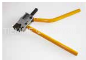
3449PRES Macchina per pressatura manuale Axial manual pressing tool