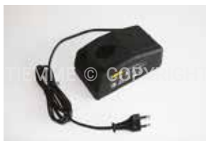
3448C Carica batteria pressatrice e macchina per espansione 230 Vac - 50-60 Hz - 65W Battery charger crimping machine and expansion tool 230Vac - 50-60 Hz - 65W