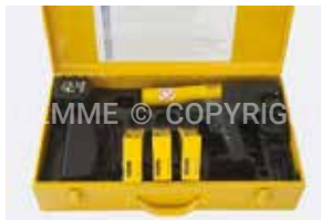
3448ESP Macchina per espansione a batteria Cordless pipe expander